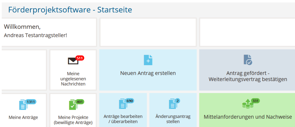
Abbildung 3 AGP Antrag stellen über das Dashboard.

Alternativ können Sie über das Dashboard das Feld „Neuen Antrag erstellen“ anklicken. Anschließend klicken Sie bei AGP-Aktionsgruppenprogramm auf den Button „Antrag erstellen“.