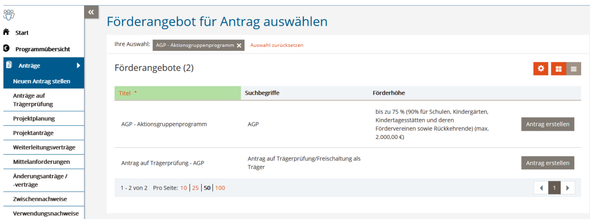
Abbildung 2 AGP Antrag stellen über das Hauptmenü.

Wählen Sie dazu im Menü links „Anträge“ und „Neuen Antrag erstellen“ aus. Auf der rechten Seite setzen Sie ein Häkchen beim AGP-Aktionsgruppenprogramm.